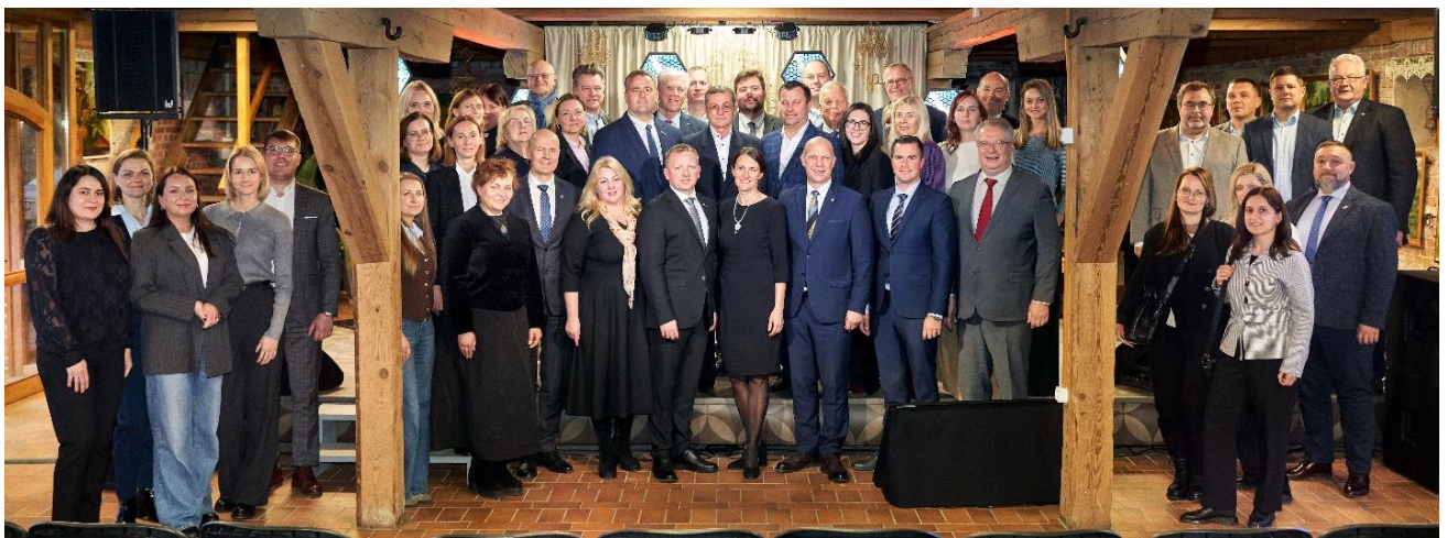
Marijampolės regiono forumas 2025

2025 m. inicijuotos diskusijos dėl regioninių investicijų po 2027 m. Balandžio mėn. vyko renginys Sūduva 2035, kuriame nacionalinės, regioninės, vietos valdžios atstovai ir socialiniai ekonominiai partneriai diskutavo ir teikė siūlymus bei kėlė problemas apie verslo situaciją šiandien ir poreikius ateityje, regiono turizmo potencialą, susisiekimo infrastruktūrą, energetinę nepriklausomybę. O baigiantis metams – lapkričio mėn., kartu su Centrine projektų valdymo agentūra organizuotas Marijampolės regiono forumas 2025. Renginys tapo svarbiu dialogu vertinant 2021–2027 m. regioninių ES investicijų rezultatus, planuojant prioritetus naujam finansavimo laikotarpiui po 2027 metų ir siekiant savivaldos, regiono ir nacionalinio lygmens institucijų glaudesnio bendradarbiavimo.